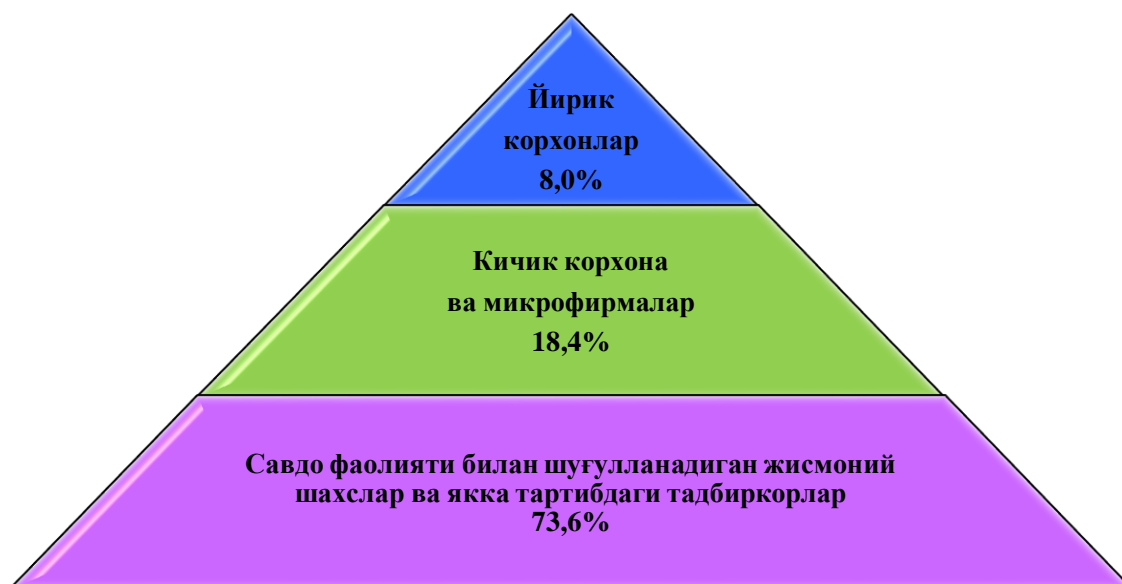
Чакана савдо товар айланмаси таркиби (2018 йилнинг январь-июнь ойларида)

Жами чакана савдо айланмасидаги йирик корхоналар улуши 7,4 фоизни, кичик корхона ва микрофирмалар 19,2 фоизни, савдо фаолияти билан шуғулланувчи жимоний шахслар ва якка тартибдаги тадбиркорлар 73,4 фоизни ташкил этиди.