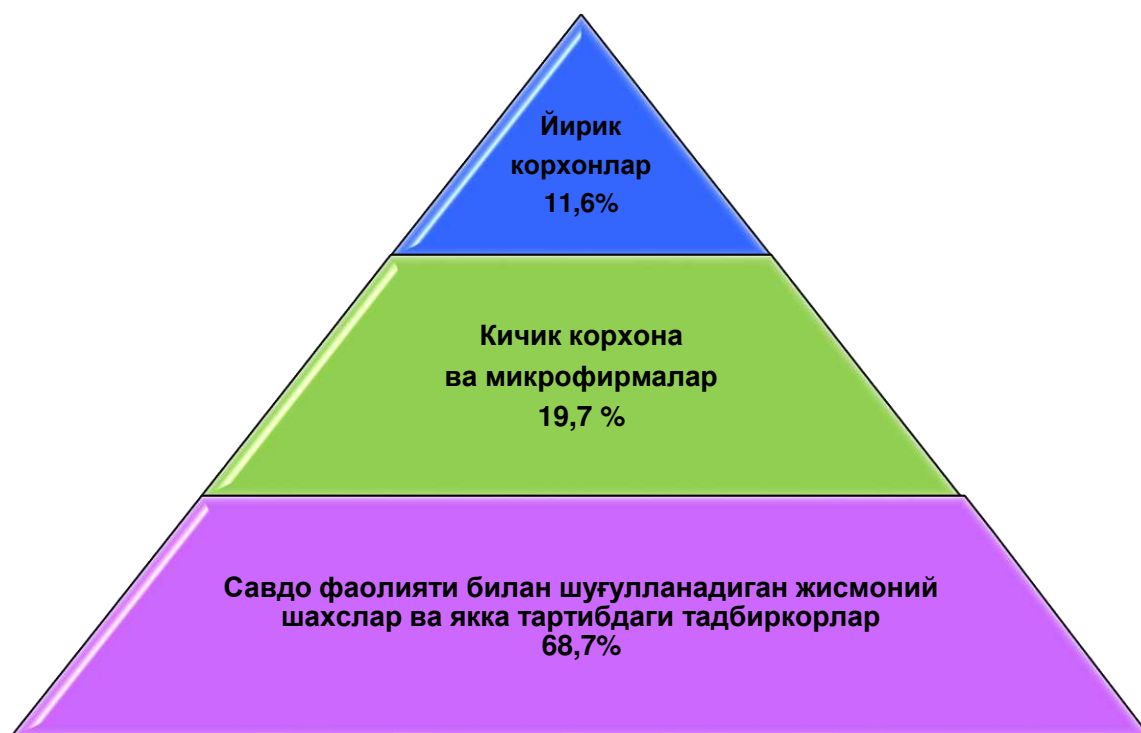
Чакана савдо товар айланмаси таркиби (2019 йилнинг январь–март ойларида)

Жами чакана савдо айланмасидаги йирик корхоналар улуши 11,6 фоизни, кичик корхона ва микрофирмалар 19,7 фоизни, савдо фаолияти билан шуғулланувчи жимоний шахслар ва якка тартибдаги тадбиркорлар 68,7 фоизни ташкил этиди.