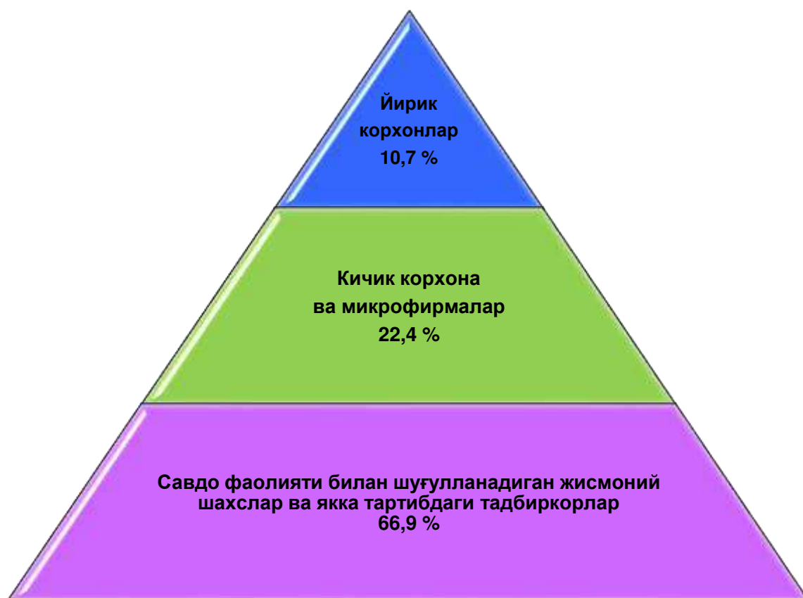
Чакана савдо товар айланмаси таркиби, % да (2019 йилнинг январь–июнь ойларида)

Жами чакана савдо айланмасидаги йирик корхоналар улуши 10,7 фоизни, кичик корхона ва микрофирмалар 22,4 фоизни, савдо фаолияти билан шуғулланувчи жимоний шахслар ва якка тартибдаги тадбиркорлар 66,9 фоизни ташкил этди.