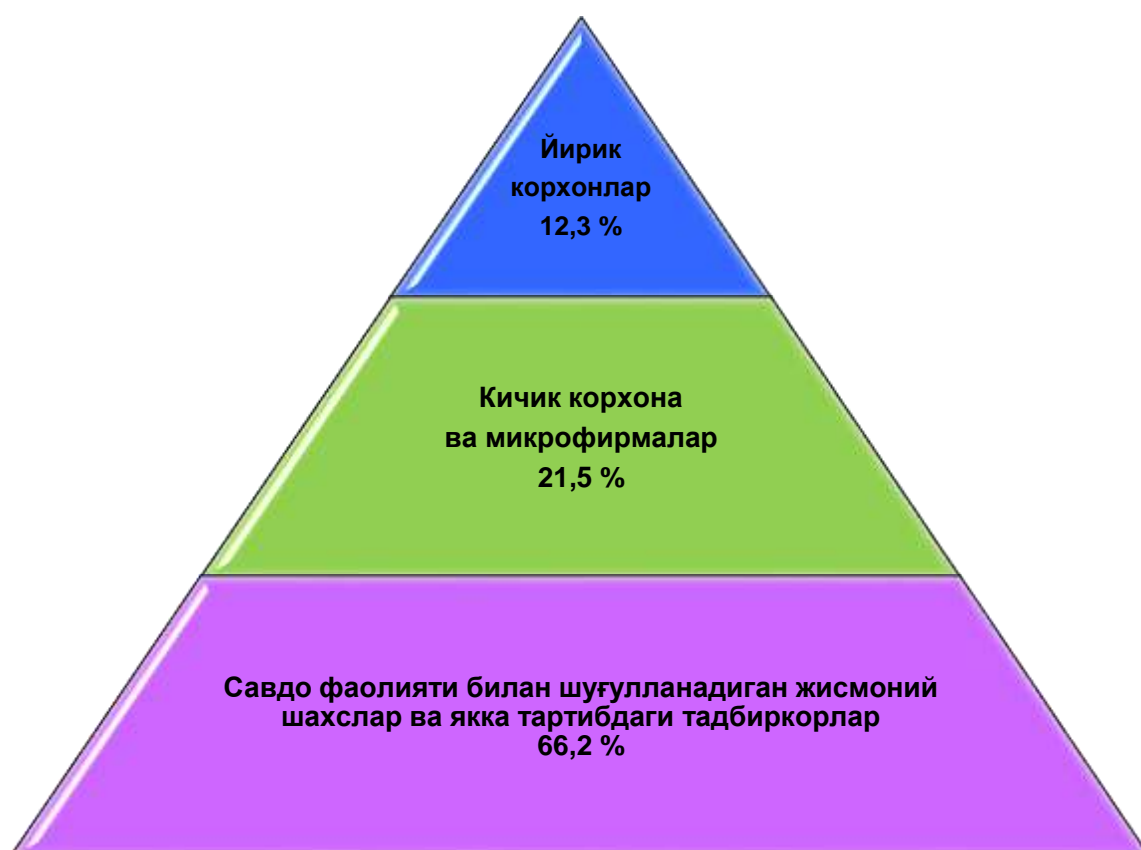
Чакана савдо товар айланмаси таркиби, % да (2019 йилнинг январь-сентябрь)

Жами чакана савдо айланмасидаги йирик корхоналар улуши 12,3 %ни, кичик корхона ва микрофирмалар 21,5 %ни, савдо фаолияти билан шуғулланувчи жимоний шахслар ва якка тартибдаги тадбиркорлар 66,2 %ни ташкил этди.